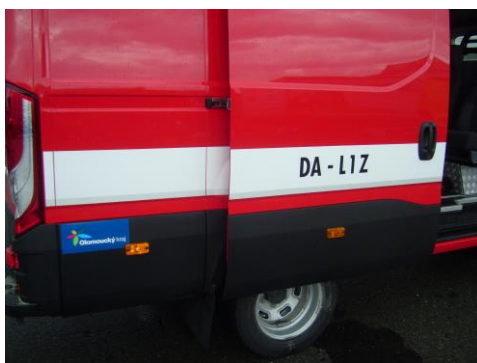
Takto bude vypadat kontejner s výzbrojí z THT Polička →